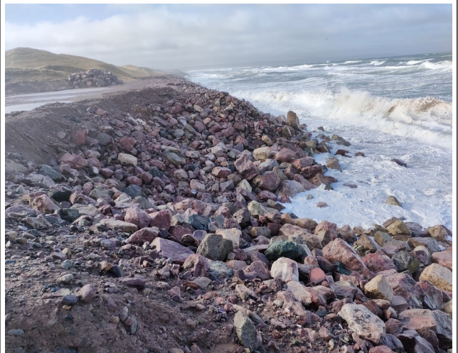
Situation de la chaussée au même endroit