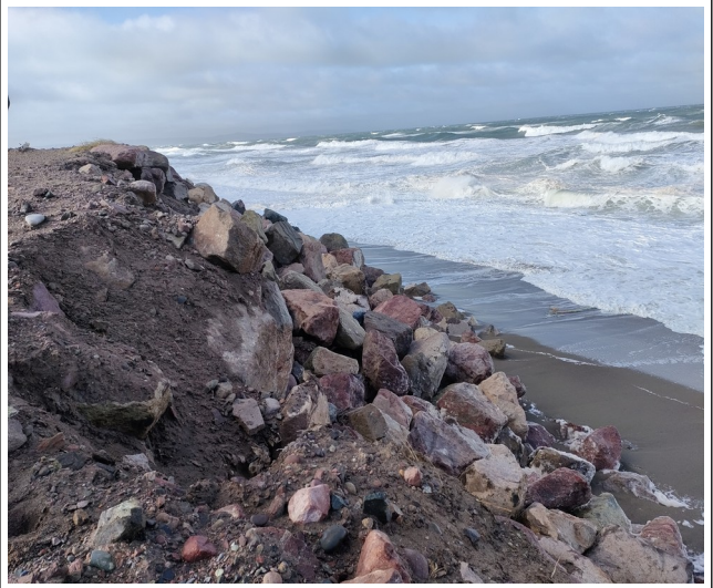
Evolution du glissement des enrochements sur la zone de parking amont