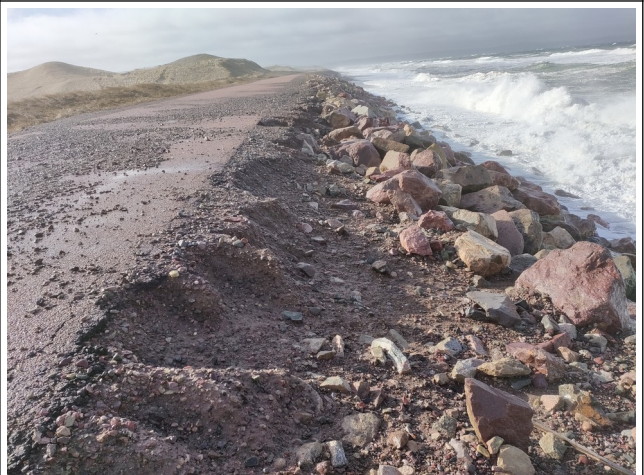
Evolution du glissement aval