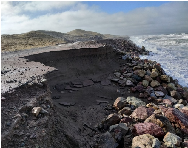
Evolution de l'érosion dans l'effondrement entre la partie digue et la plateforme centrale