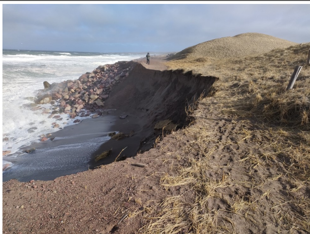
Evolution de l'effondrement aval